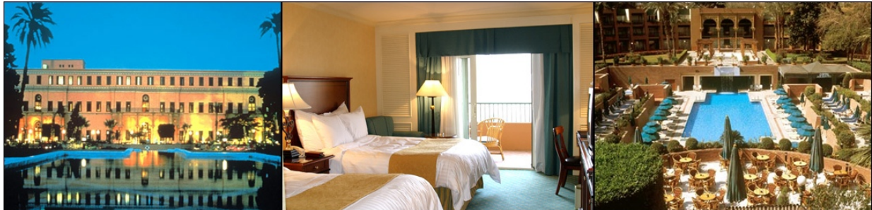
Marriott Palace Zamalek